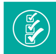
Informes de Seguimiento