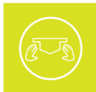
Mufor nivel Micro

Después de ingresar aparecerán los botones con el menú para la subida de los informes y posteriormente el listado de asignaturas pertenecientes al docente