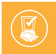
Concertación de Evaluación